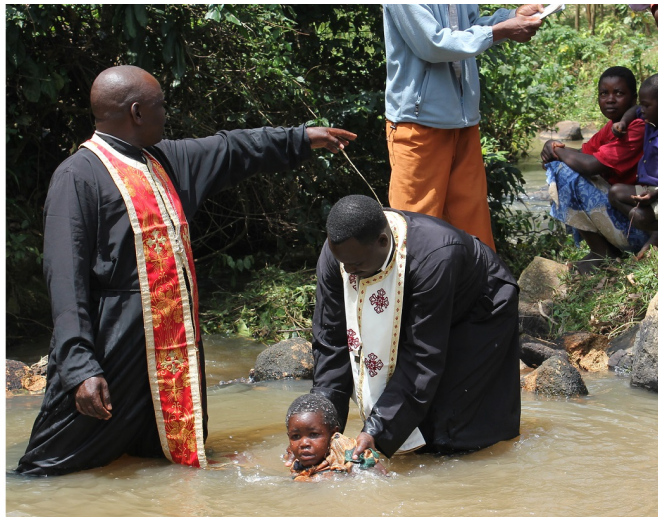
Православное крещение в Кении

На самом деле, по христианскому пониманию, дети должны быть крещены по вере тех, кто приносит их ко Христу: по вере родителей и восприемников. Подобно тому, как Христос благословил детей (Мк. 10:16) по вере в Него тех, кто приносил их, так Спаситель дарует детям благодать крещения, по вере их родителей и восприемников.