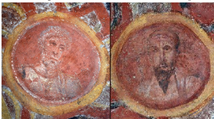
Древнейшие иконы апостолов Петра и Павла. Катакомбы св. Феклы, Рим, IV век.

из двух противоположных стихий — огня и воды. Учитесь здесь, все враждующие, истинному единомыслию и дружбе на примере этой двоицы апостольской, и вы достигнете земли обетованной, Царствия Небесного.