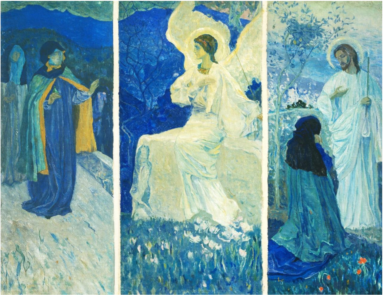
Картина М. В. Нестерова «Воскресение Христа»