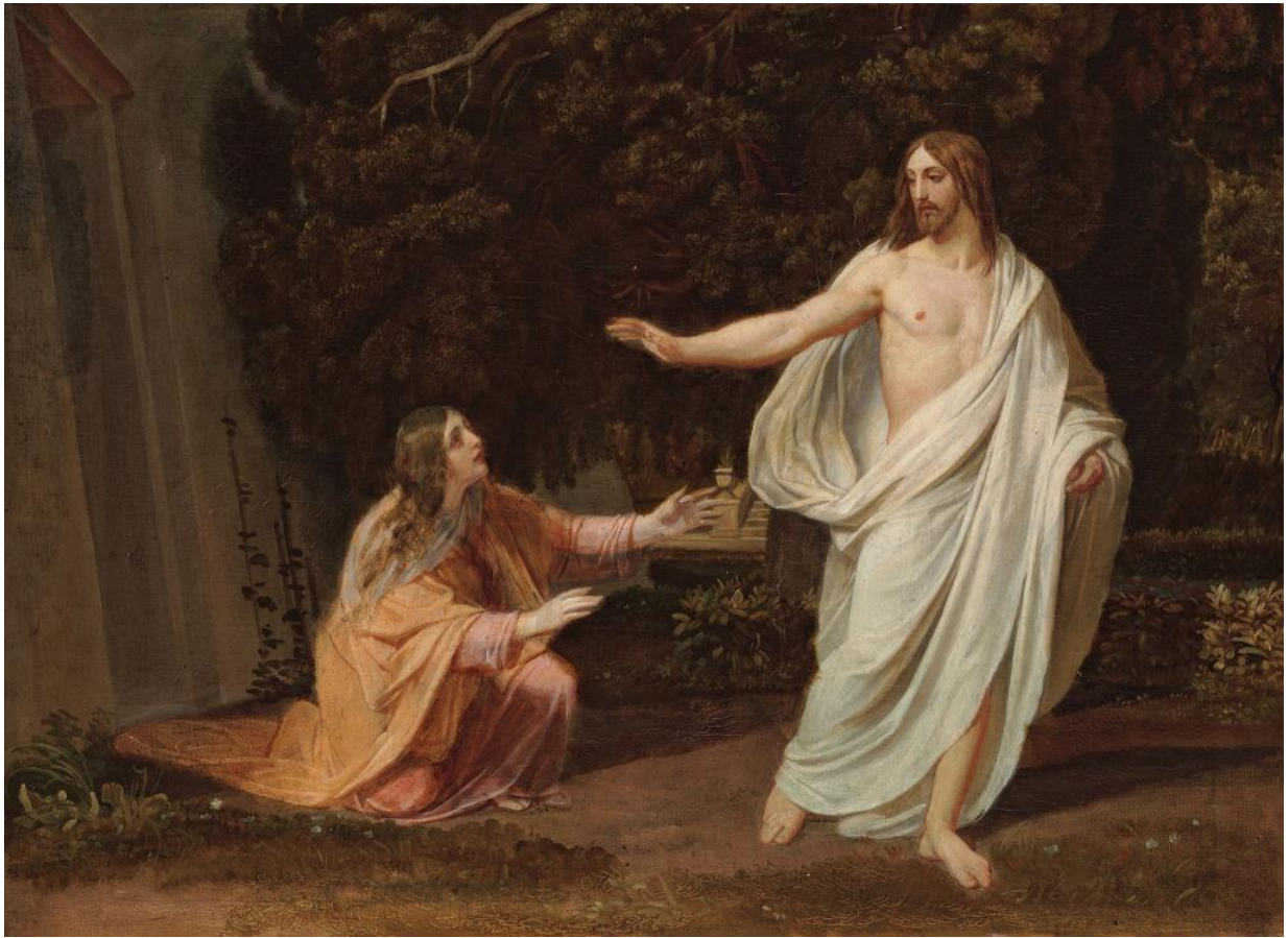
Картина А. Иванова «Явление Христа Марии Магдалине после воскресения»